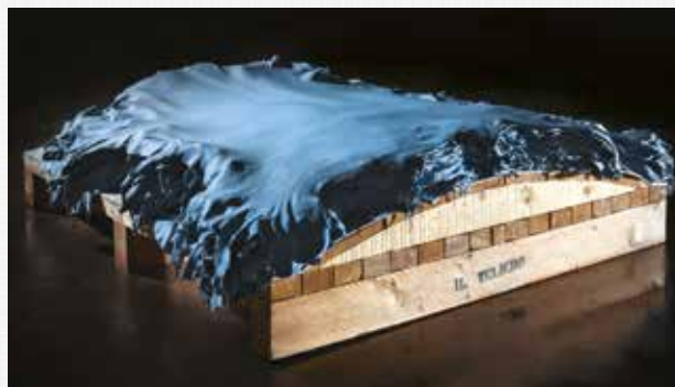
Resting: pellame riposa per circa 60/90 giorni su particolari bancali a schiena d'asino negli appositi magazzini del Il Veliero